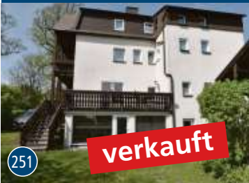
Bad Steben – Gästehaus