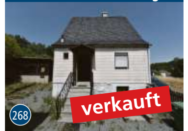
Schwarzenbach a. W.-Sorg