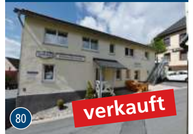
Enchenreuth – Pension