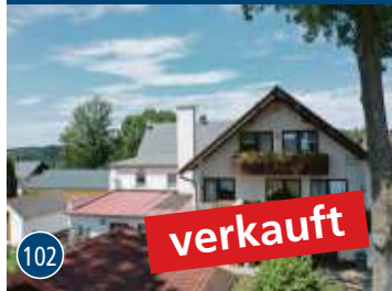
Schwarzenbach a. W.-Löhmar Gasthof